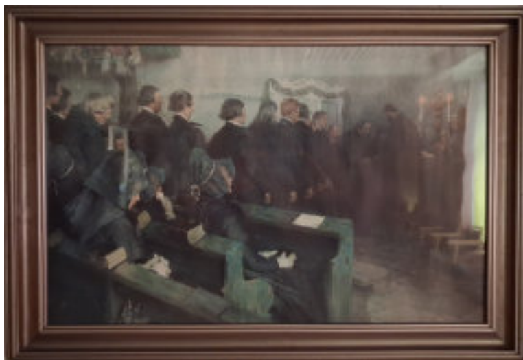
„Abendmahl in einer hessischen Dorfkirche“ von Professor Bantzer, Mitglied der Willingshäuser Malerkolonie (Schwalm), 1892

Das Bild (Druck) hat eine lange Geschichte. Ursprünglich ein Abschiedsgeschenk an meine Großeltern, da mein Großvater nach Berlin versetzt wurde. Es kam somit in Familienbesitz. In Königsberg war mein Großvater als Amtsrat stationiert. Dort lebten zu