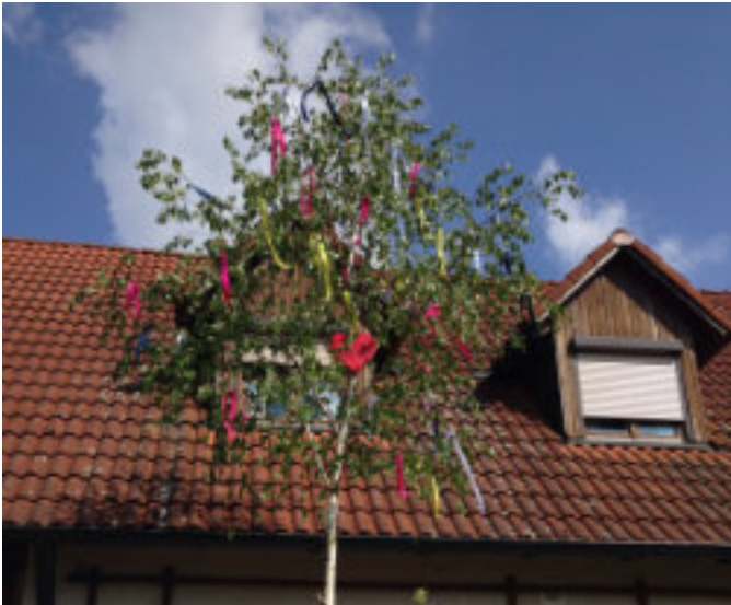
Ein Liebesmaien für die Angebetete

Fruchtbarkeit und Lebenskraft verehrt wurden.